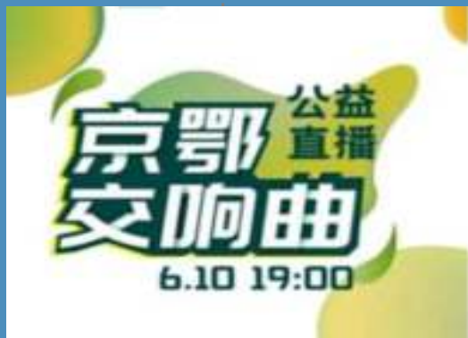
湖北助农带货直播